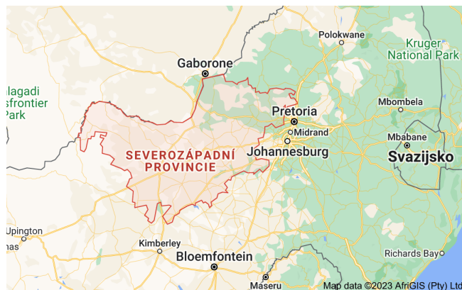
Území severozápadní provincie

Naše první zkušenosti se určitě zapíší na dlouho do paměti, někdy také na celý život. Ve vánoční době v Jižní Africe vrcholí horké léto (až 40° C), je to doba velkých školních prázdnin a pro ty, kdo si to mohou dovolit, také čas s rodinou u moře nebo prostě návrat ke kořenům. A tak se desítky milionů obyvatel vrací z měst do rodných vesnic, pokud to pracovní podmínky dovolí – zvláště ti, co pocházejí ze Zimbabwe, Lesotho, Mozambiku, Malawi nebo dalších přilehlých zemí. Pro mě to znamená, že „musím být doma“, protože naši místní spolubratři se rozjíždějí domů do svého rodiště (někdy vzdáleného 1000-2000 km) zhruba od poloviny prosince do začátku ledna. Školní rok se tu rozbíhá přibližně v polovině ledna, jsou mírné rozdíly v jednotlivých zemích. To znamená, že na školách děláme náборы našich domácích dobrovolníků (12 měsíců se salesiány) nebo také víkendy pro mladé, kteří se zajímají o povolání.